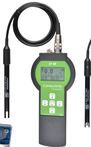
Leitfähigkeits-Messgerät Conductivity Meter